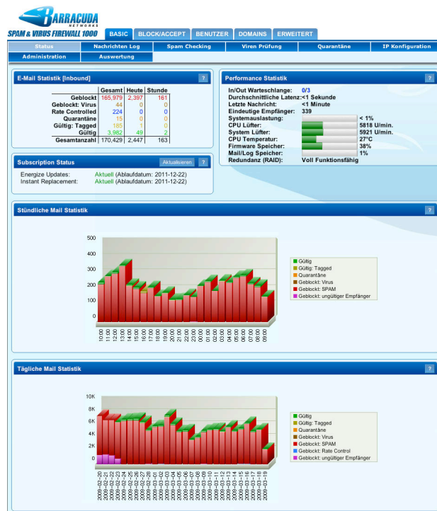
Die Barracuda Spam & Virus Firewall filtert alle Emails und zeigt die Anzahl der empfangenen Emails sowie eine statistische Übersicht wie sie klassifiziert wurden.

Die Barracuda Spam & Virus Firewall fertigt durch ihren mehrstufigen Aufbau problemlos Millionen von Nachrichten täglich ab. Im Gegensatz zu Software Lösungen reduziert die Barracuda Spam & Virus Firewall die Last des Email Servers durch vorgeschaltete Antivirus-Engines und Spamfilter. Ihre Architektur mit 12 intelligenten Abwehrstufen bietet damit branchenführende Abwehrmöglichkeiten.